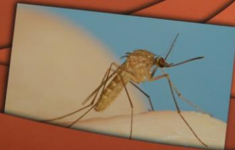
Culex pipiens Obični komarac