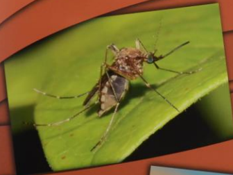
Aedes vexans Poplavni komarac